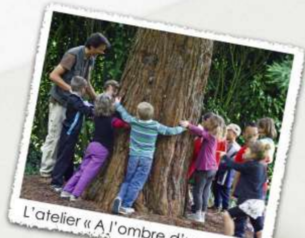
L'atelier « A l'ombre d'un arbre »