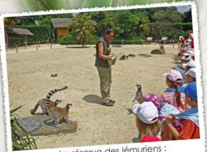
La réserve des lémuriens : Lieu unique d'observation