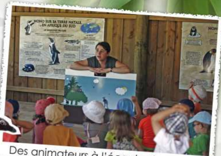
Des animateurs à l'écoute des enfants