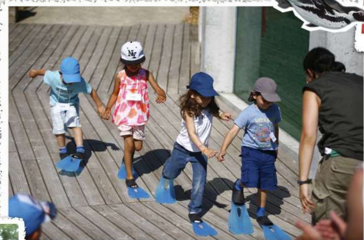
Atelier manchots : des jeux ludiques et pédagogiques