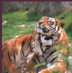
Le mâle peut occuper le territoire de 3 ou 4 femelles.