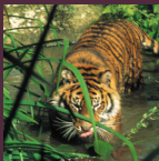
Le tigre aime l'eau et s'y baigne souvent.