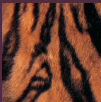
La peau du tigre est rayée.