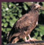
A l'âge d'un an, le percnoptère a une couleur grise.