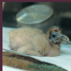
A la nalsanco, il pèse seulement 60 gr.