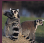
Le maki catta imprègne sa queue d'odeurs grâce à une glande située sur ses avant-bras.