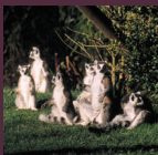
Assis, bras écartés, ces lemuriens aiment profiter des rayons de soleil.