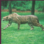
Le guépard est en phase d'approche.