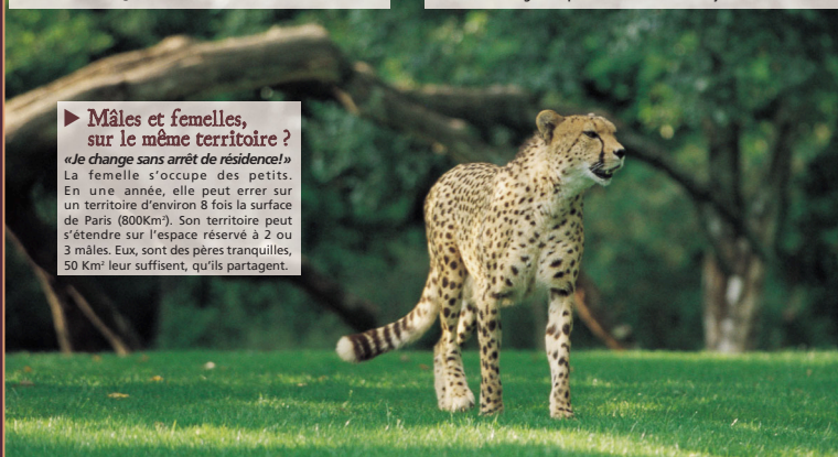
Conception : Gilles LEBRETON

La femelle s'occupe des petits. En une année, elle peut errer sur un territoire d'environ 8 fois la surface de Paris (800Km 2 ). Son territoire peut s'étendre sur l'espace réservé à 2 ou 3 mâles. Eux, sont des pères tranquilles, 50 Km 2 leur suffisent, qu'ils partagent.